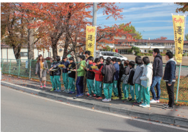
図3 学校周辺散策による地域学習の様子

今回実施対象とした八幡平市立寄木小学校周辺は、岩手山の北東麓に位置し、土砂災害や洪水災害の常襲地域であり、2013年にも寄木小学校付近まで洪水が到達している。そのため、岩屑なだれの流山部を洪水堆積物や土石流堆積物が埋めている。さらに神社等は周辺より若干標高の高い流山の頂部に建立されている場合が多い。対象小学校との相談の上、対象学年は6年生（14名）、実施日は、2018年11月5日、12日、19日の延べ3回、いずれも10:30-12:00までと決定された。そこで、これら地域の特徴と自然災害との関係を、児童が直感的に理解できるよう、「地域散策による地域発見」、「地域の成り立ちと災害」、「未来の松尾寄木」を学習のコンセプトとして、プログラムを構築した。その際、第1回目の学習では、UAVによる学校周辺の地形観察や、実際に学校周辺を散策し、2回目には「降雨体験装置による大雨と災害の関係」とプロジェクションマッピングによる土地利用状況の理解、3回目にはブロック玩具を用いて地域の持続的な発展を意識させるよう工夫した。また、それぞれの学習の最後に自由記述式のアンケートを実施し、記述されたテキストについて共起ネットワークによるクラスター分析を行い、その効果について検証を行った結果、降雨体験から土地の成り立ちが有機的にネットワークしているクラスターが確認された。これらのことから本プログラムの有効性が確認された。