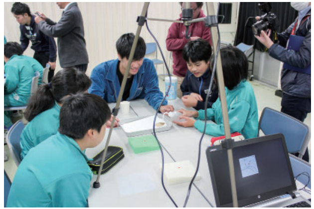
図4 プロジェクションマッピングによる地域の変遷学習の様子