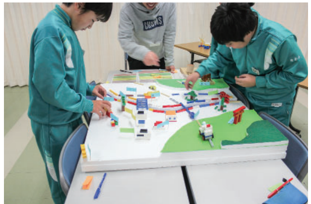
図5 ブロック玩具を用いた未来の地域ワークショップの様子