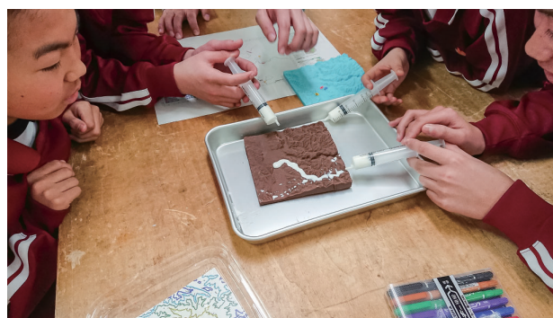
図2 3Dプリンターで出力した地形モデルを用いた洪水氾濫実験