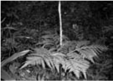
ナガホノナツノハナワラビ (2012/09/20)