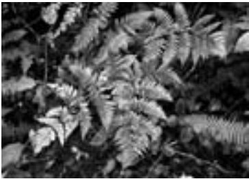
ミヤマイタチシダ (2010/10/01)