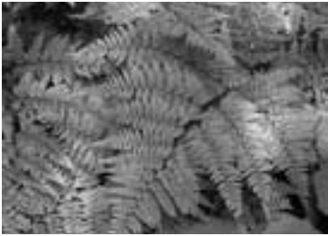
ホソバナライシダ (2008/05/30)