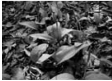
ヒロハハナヤスリ (2007/05/23)