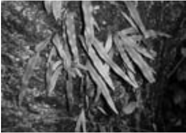
ミヤマノキシノブ (2012/10/01)