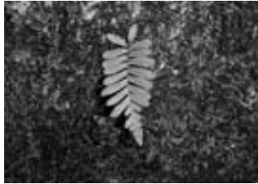
オシャグジデンダ (2012/10/01)