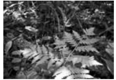
ナツノハナワラビ (2011/06/03)